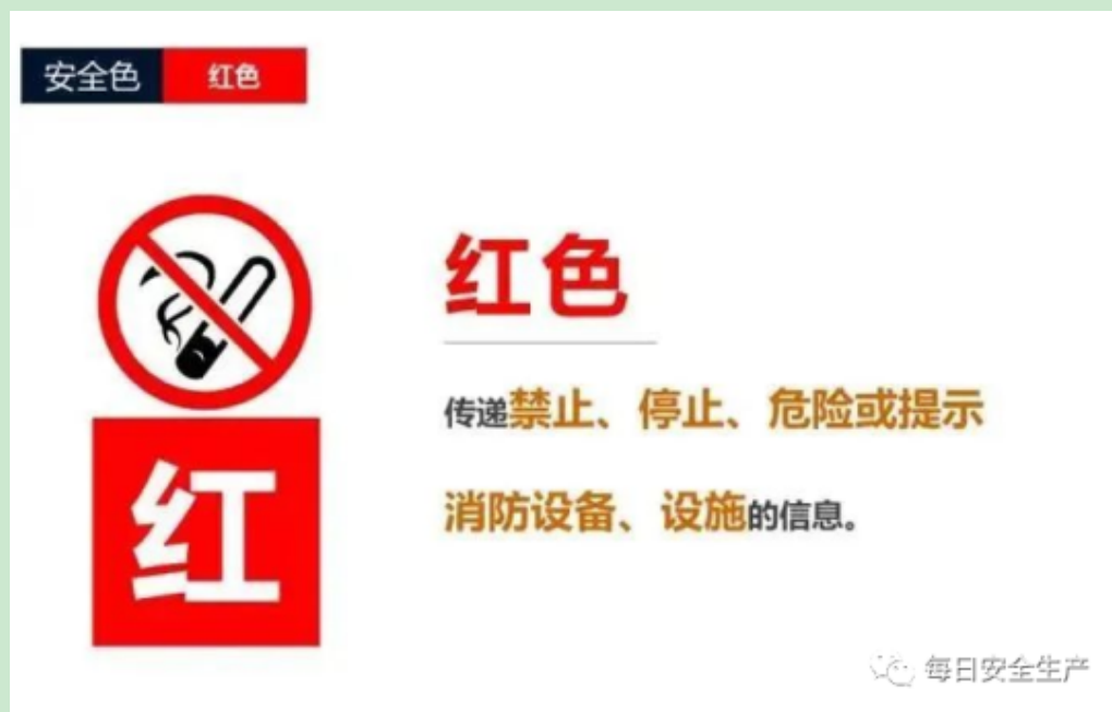
表13 危险源标识标志管理