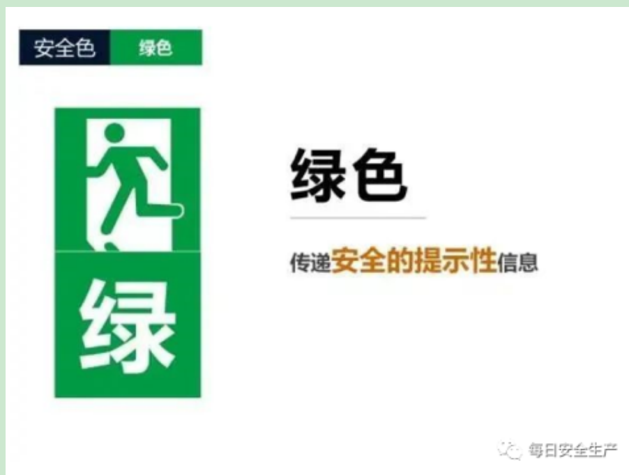
表13 危险源标识标志管理